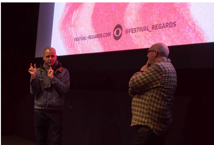
Abdellah Taia - Cabo Negro