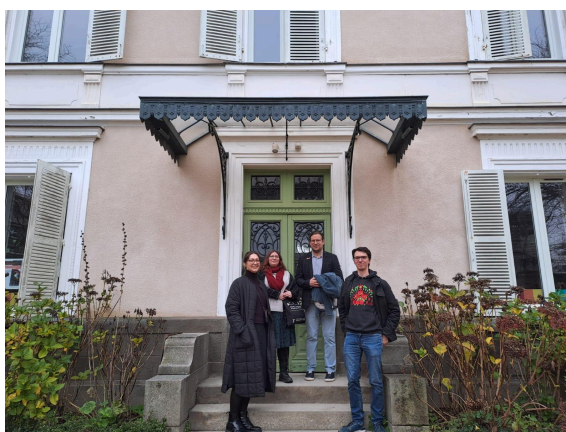
L'association STUD chez ISKIS