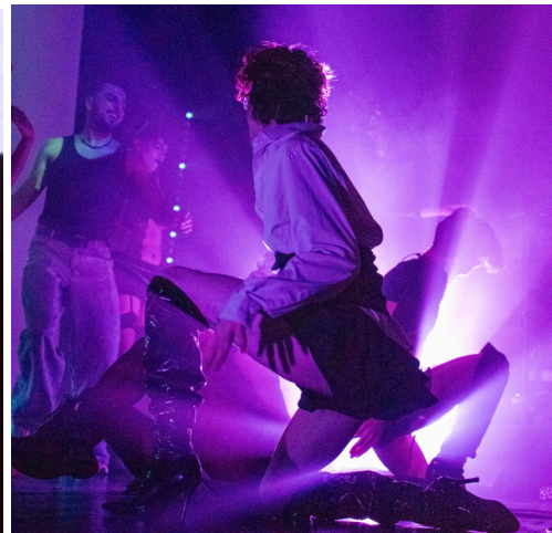
Des soirées queers