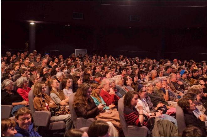
Des salles combles

Le festival Regard(s) a aussi été l'occasion d'accueillir des élu.es et représentant.es de l'association de république tchèque STUD de Brno, ville jumelle de Rennes. L'occasion d'échanger avec le réseau LGBTQI+ de Rennes, afin de se tenir au courant de l'évolution des droits LGBTQI+ en Europe, et de souder les liens entre les associations des différents pays.