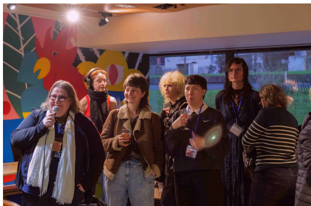
Équipe de programmation

L'équipe du festival, au travers d'ISKIS, a adhéré à la fédération des festivals LGBTQIA+, et a rejoint les 20 festivals déjà référencés en France.