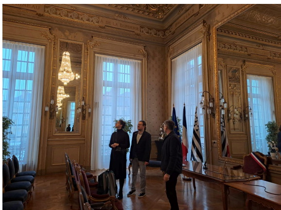
Accueil à la mairie de Rennes

Face aux discriminations qui persistent et peuvent même s'accroître, suivant le contexte politique du pays, les échanges entre pairs et au travers la culture ont montré qu'ils étaient des leviers dynamisants pour partager les bonnes pratiques locales en faveur de la diversité.