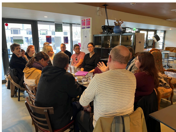
Echanges sur les activités LGBTI+ associatives en France et en Pologne